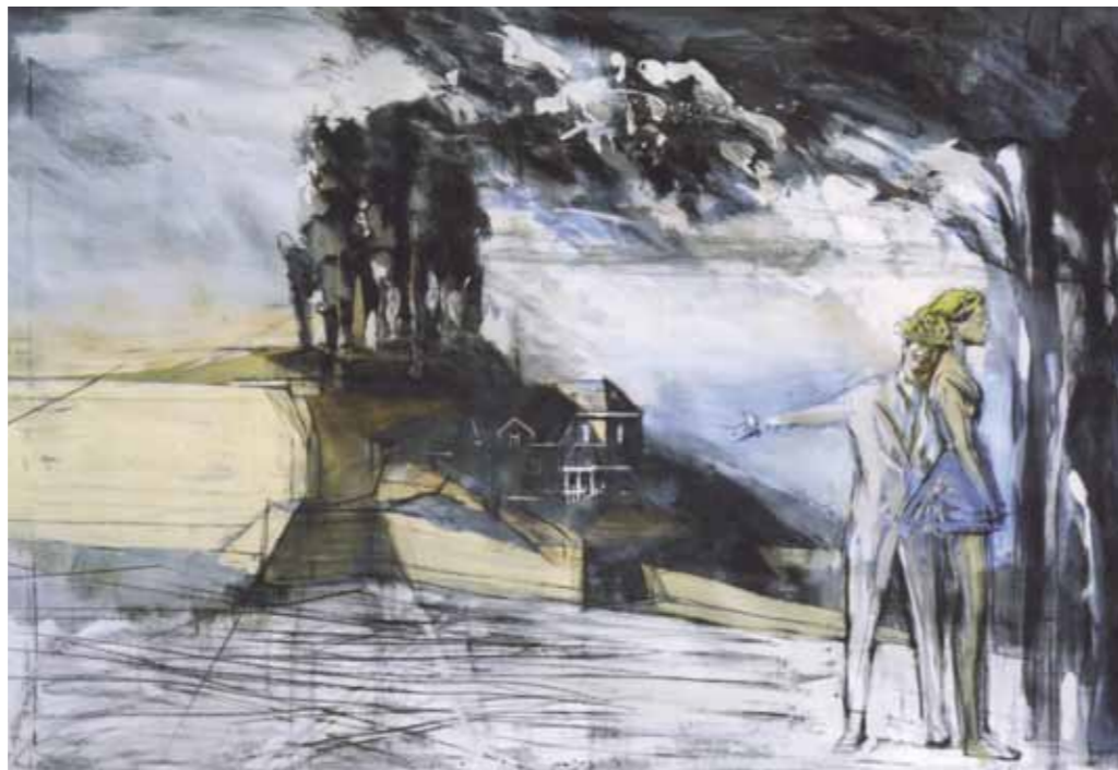
La citadelle, techniques mixtes sur papier - 110 x 80 cm

12 rue Saint-Remy - 4000 LIEGE Tél. 04 / 222 49 46 - GSM 0475 / 92 07 97 www.galerie-saint-remy.be christine.colon@skynet.be