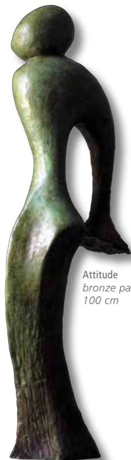
Attitude bronze patiné 100 cm

Je tente à travers mes œuvres, d'exprimer la force des sentiments en prenant pour thèmes principaux soit la femme et le couple, soit l'abstraction totale. Loin de la simplification, ma démarche est guidée par la recherche de l'harmonie dans la perfection des courbes et l'aspect contrasté des surfaces en variant rugosités, patines et reflets à la lumière. Des thèmes récurrents comme la spirale, les cannelures, les formes élancées apparaissent principalement dans les œuvres abstraites.