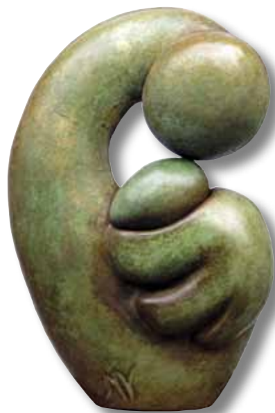
Maternité, bronze patiné - 60 cm

Je me consacre actuellement à la sculpture en utilisant différentes techniques comme la taille directe sur la pierre, le bois ou polystyrène, le modelage et le moulage de la terre pour réaliser des bronzes ou des résines. J'aime associer les différents matériaux entre eux et aussi avec le bois, le piédestal des œuvres en faisant souvent intégralement partie.