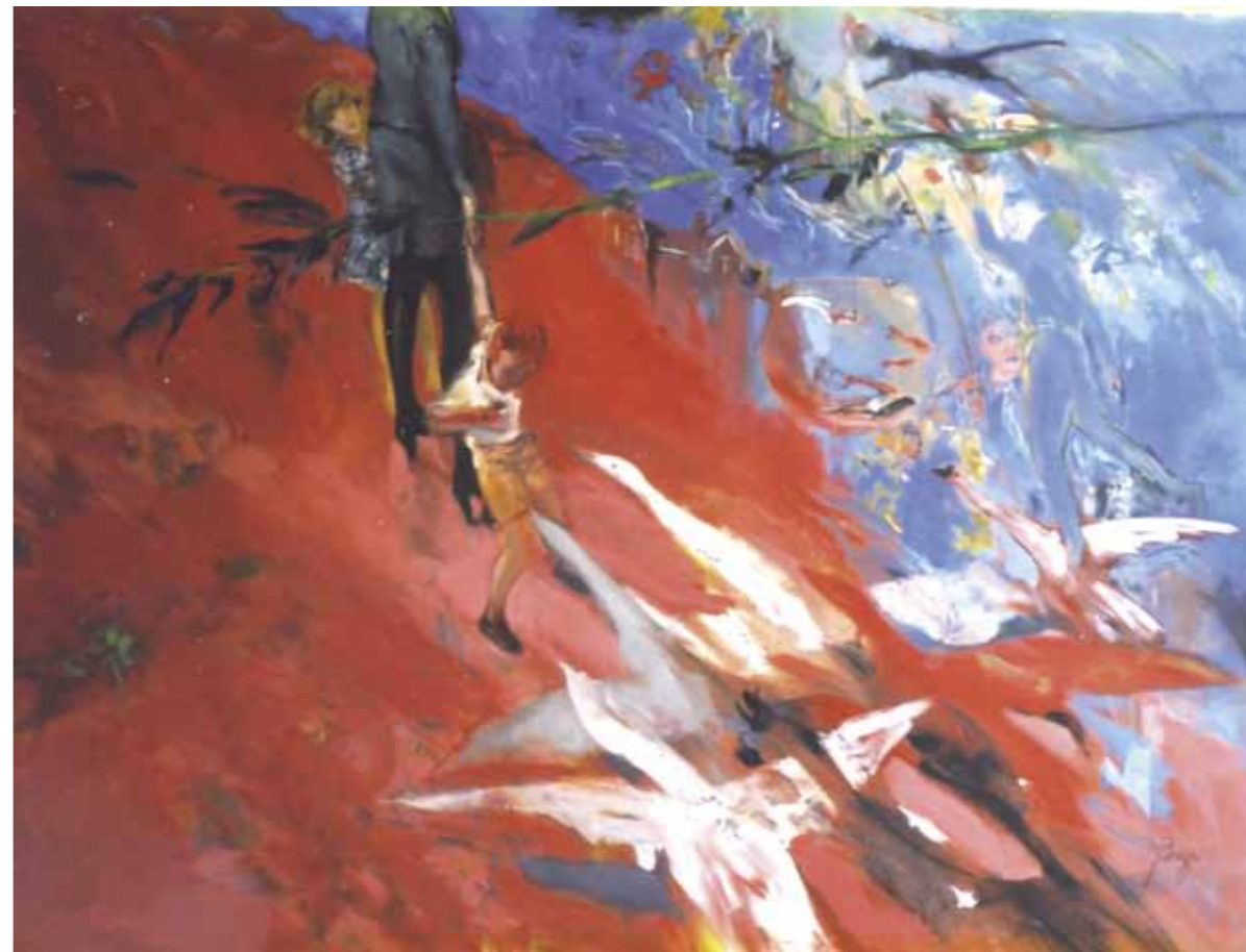
Les oies, huile sur toile - 190 x 160 cm